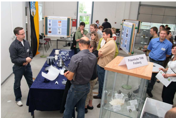
Dicht belagert: Die Ausstellung des Fraunhofer THM in Freiberg bei der Nacht der Wissenschaft und Wirtschaft.

Rund 700 Schaulustige aller Altersstufen besuchten am 20. Juni 2009 zur Nacht der Wissenschaft und Wirtschaft in Freiberg das Fraunhofer Technologiezentrum Halbleitermaterialien (THM). Das Fraunhofer THM ist eine gemeinsame Außenstelle des Fraunhofer IISB in Erlangen und des Fraunhofer ISE in Freiburg mit dem Ziel, die regionale Halbleitermaterial-Industrie zu unterstützen. Im Rahmen der Veranstaltung gab das THM der Öffentlichkeit einen breiten Einblick in die faszinierende Kunst und Wissenschaft der Kristallzüchtung. In einer Ausstellung mit Schautafeln, Mineralien und technischen Exponaten erklärten die Fraunhofer-Forscher ihren Gästen die Bedeutung von Halbleiterkristallen und deren Anwendungsmöglichkeiten in der Mikroelektronik und Photovoltaik. Zahlreiche Schaustücke illustrierten die vielfältigen industriellen Herstellungsverfahren und die während der Kristallzüchtung eingesetzte Messtechnik. In Experimenten konnten die Besucher das Kristallwachstum am Beispiel von Alaun-Salz „live“ unter dem Mikroskop mitverfolgen und Anleitungen für eigene kleine Experimente mit nach Hause nehmen. Nach dem gelungenen Auftakt und der überaus positiven Resonanz ist eine Teilnahme des Fraunhofer THM an der nächsten Nacht der Wissenschaft und Wirtschaft in Freiberg bereits fest geplant.