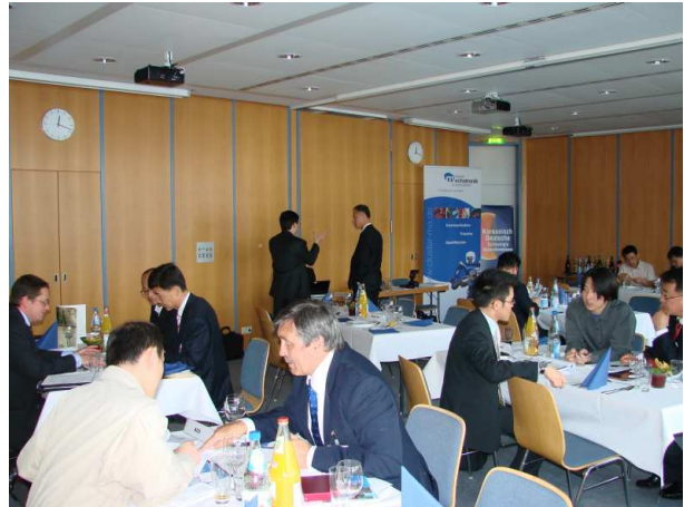
Vertreter deutscher und koreanischer Unternehmen im Gespräch.

Thematische Schwerpunkte der Kooperationsgespräche waren unter anderem Technologien für energieeffiziente Antriebs- und Automatisierungslösungen. Mit seinen umfassenden Kompetenzen im Bereich der Leistungselektronik, Energieeffizienz und Elektromobilität war das IISB als Partner der IHK Nürnberg für Mittelfranken der ideale Austragungsort.