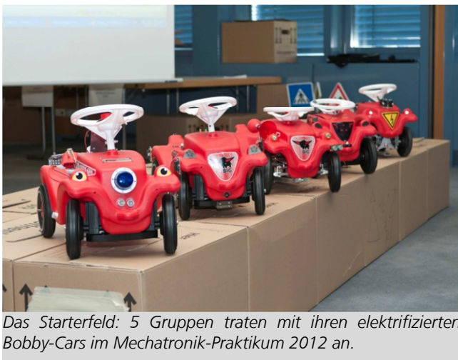
Das Starterfeld: 5 Gruppen traten mit ihren elektrifizierten Bobby-Cars im Mechatronik-Praktikum 2012 an.

Das Praktikum Mechatronische Systeme wird seit 2003 im Studiengang Mechatronik der FAU angeboten und ist für die Studierenden das Highlight des Semesters. Bei der Abschlussveranstaltung am 11. Juli 2012 wurde die Funktionsfähigkeit der entwickelten Systeme geprüft und in einem spannenden Wettbewerb das Sieger-Team ermittelt.