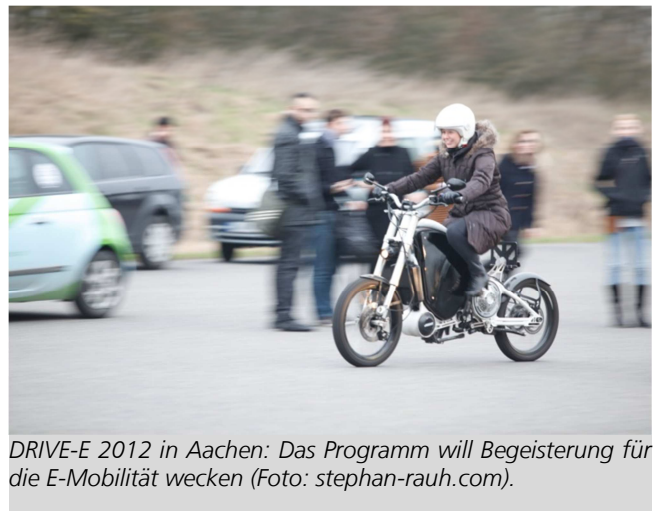
DRIVE-E 2012 in Aachen: Das Programm will Begeisterung für die E-Mobilität wecken.

Die mittlerweile vierte DRIVE-E-Akademie findet im kommenden Jahr vom 4. bis 8. März 2013 in Kooperation mit der TU Dresden und dem Fraunhofer IVI statt. Die DRIVE-E-Studienpreise werden am 6. März verliehen. Bewerbungen für Akademie und Studienpreis können unabhängig voneinander bis zum 7. Januar 2013 unter www.drive-e.org eingereicht werden.